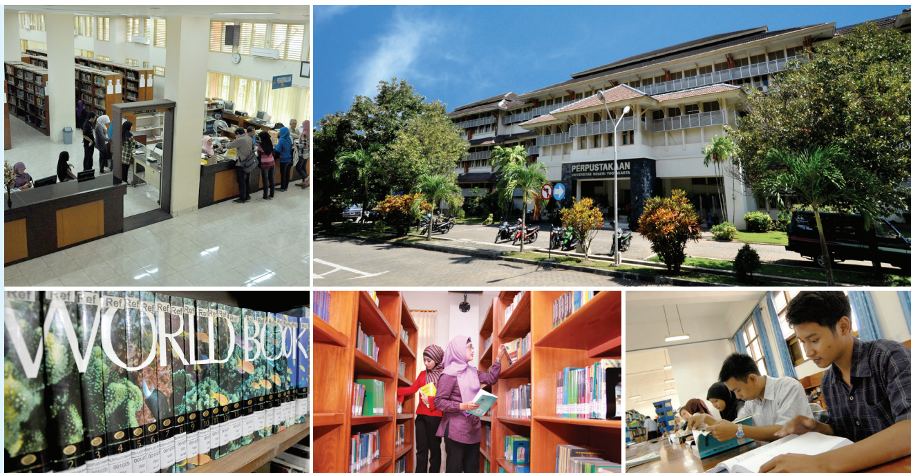
Tabel 19. Jumlah Koleksi Buku Perpustakaan UNY (Keadaan Desember 2012)